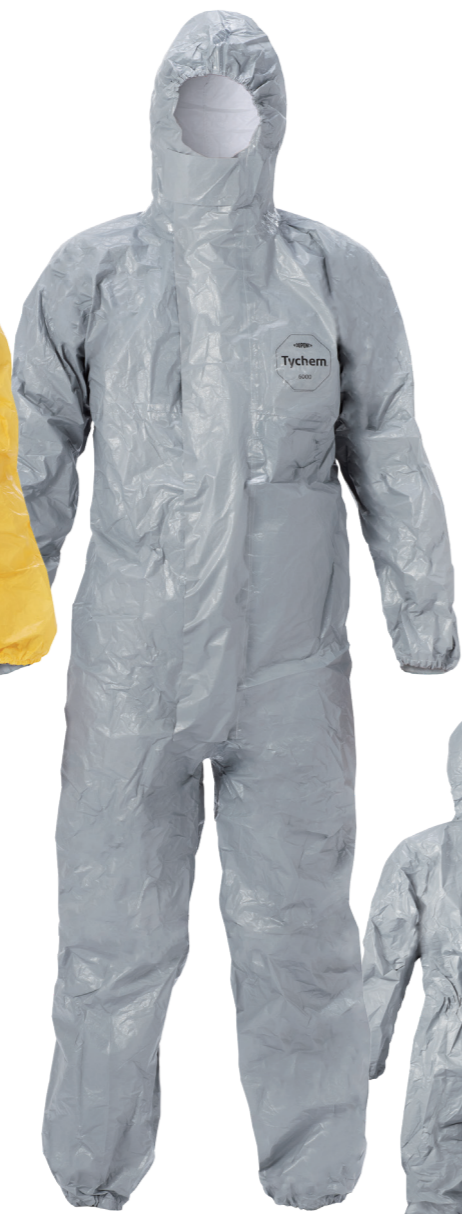
デュポン™ タイケム® 6000