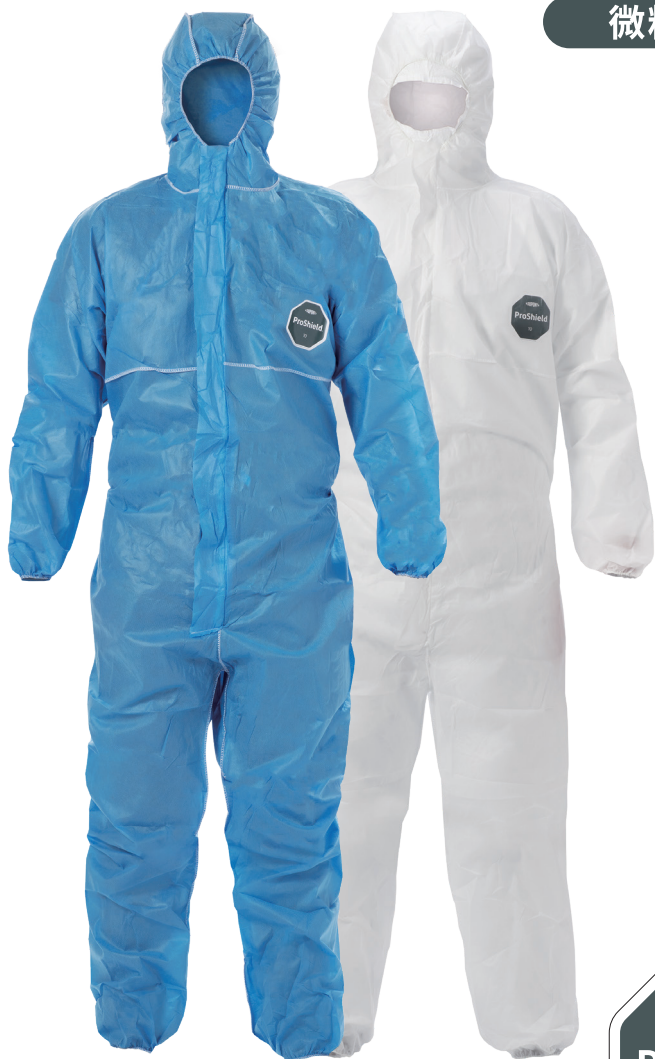
デュポン™ プロシールド®.10