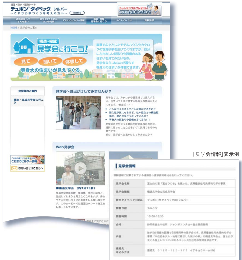
「見学会情報」表示例