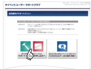
会員様向けサポートメニュー画面

TOP画面よりログイン後に、画面左にある「サポートツールのお申し込みへ」のボタンを押します。