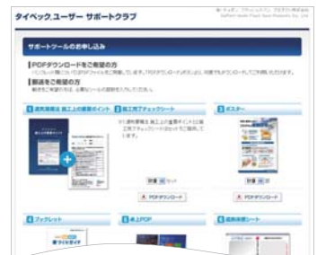
サポートツール お申込み画面

ご希望のツール・部数をご選択の上、お申し込みいただくだけで、ご登録された住所にお送りする手続きが完了します。通常は、お申込みより1週間から10日間でお届けいたします。また、お届け先の住所(展示会場や施工現場など)も簡単にご変更いただけます。