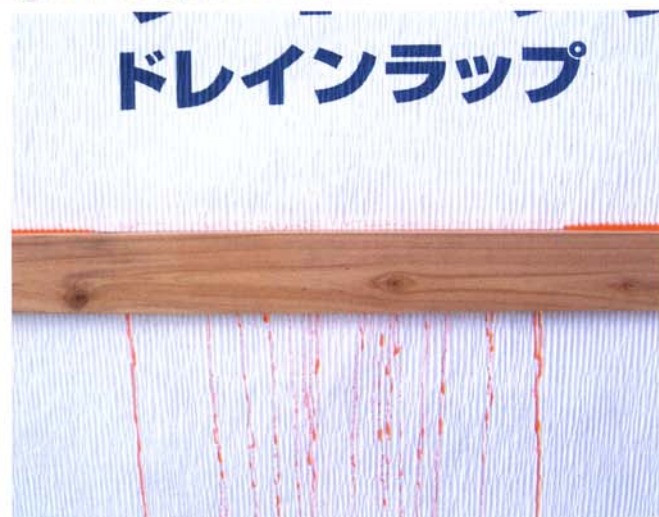
シワの隙間から排水されます。